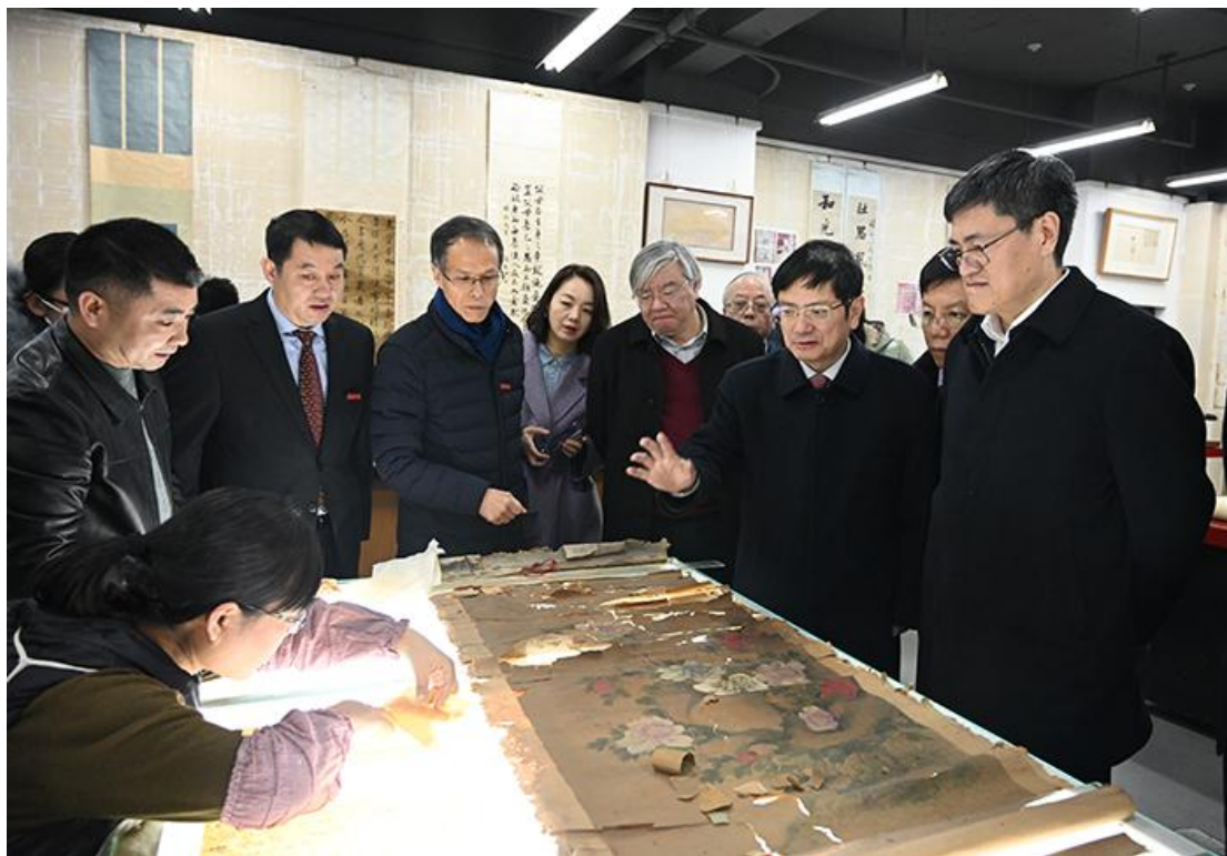
参观文物修复实验室