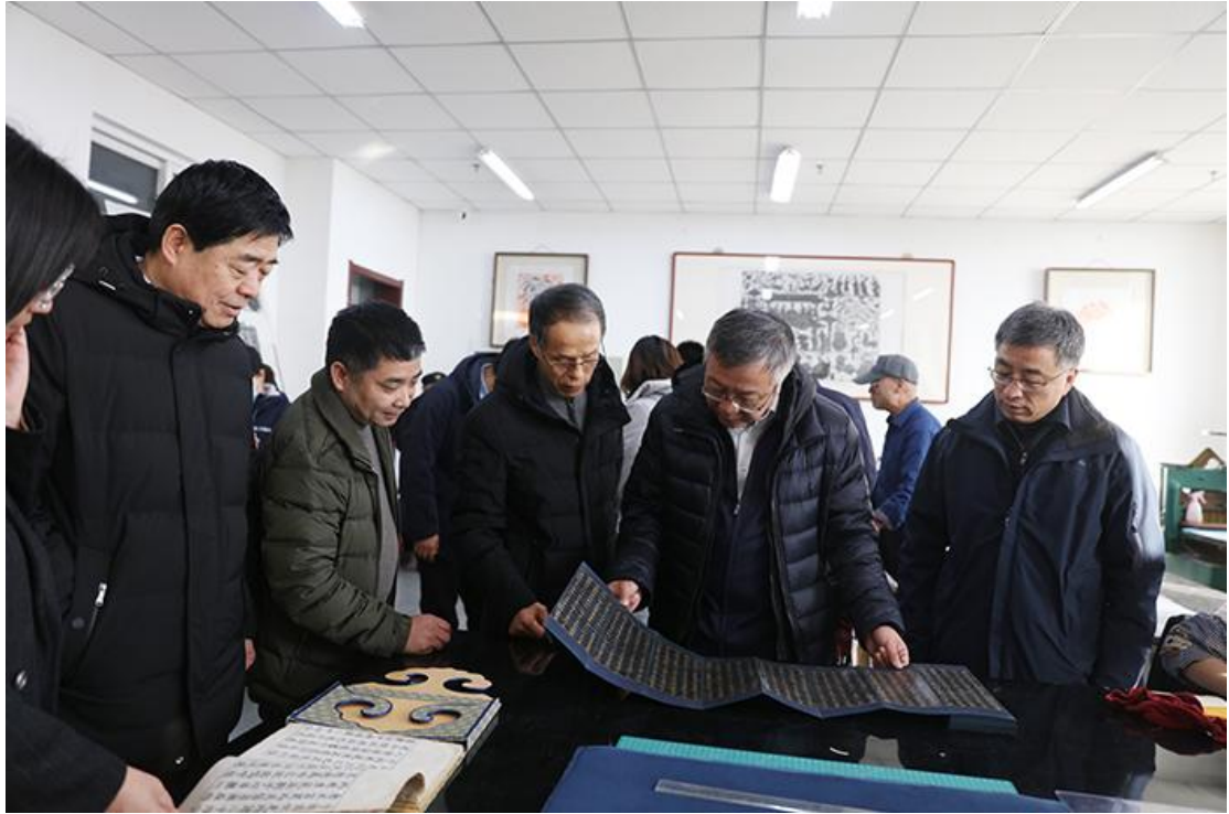
调研文物保护与修复实验室