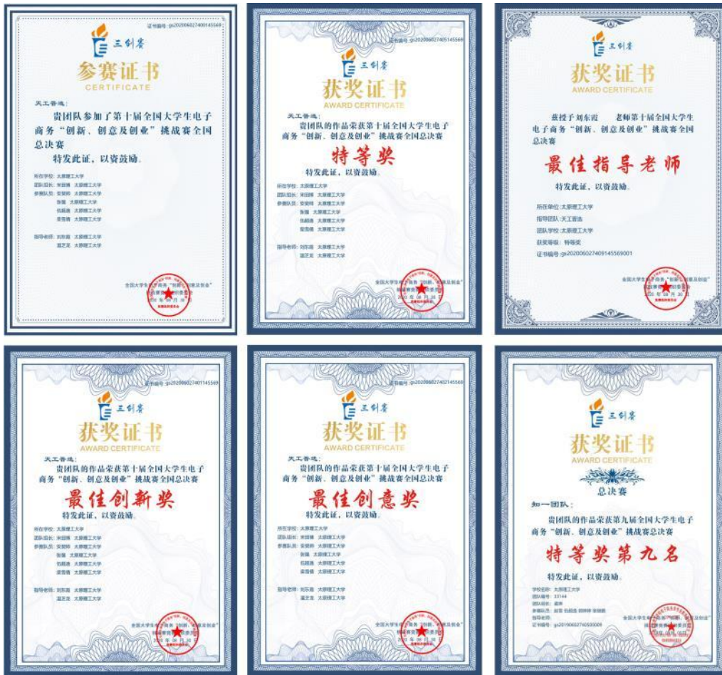
第十届全国大学生电子商务“创新、创意及创业”挑战赛