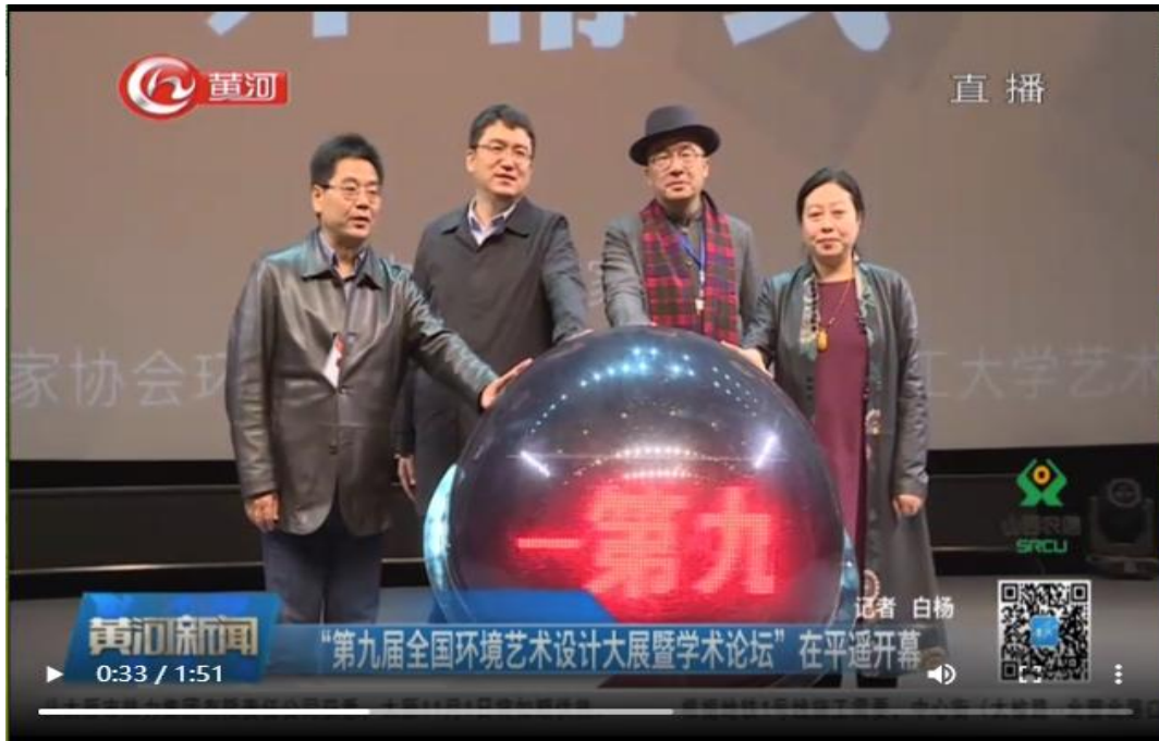
黄河电视台的报道