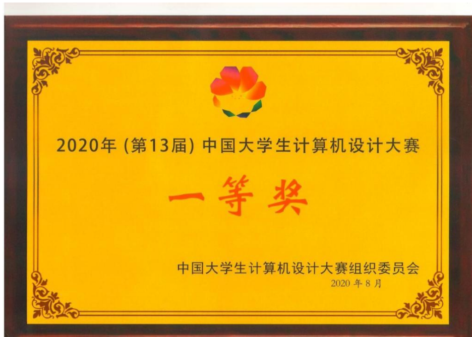
第十三届中国大学生计算机设计大赛一等奖